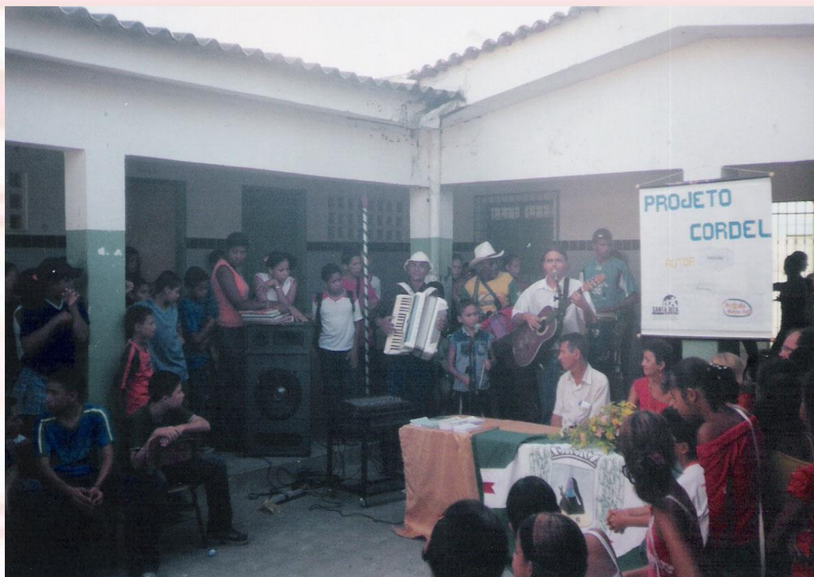
Escola Municipal Monsenhor Rafael de Barros Santa Rita-PB - 2006