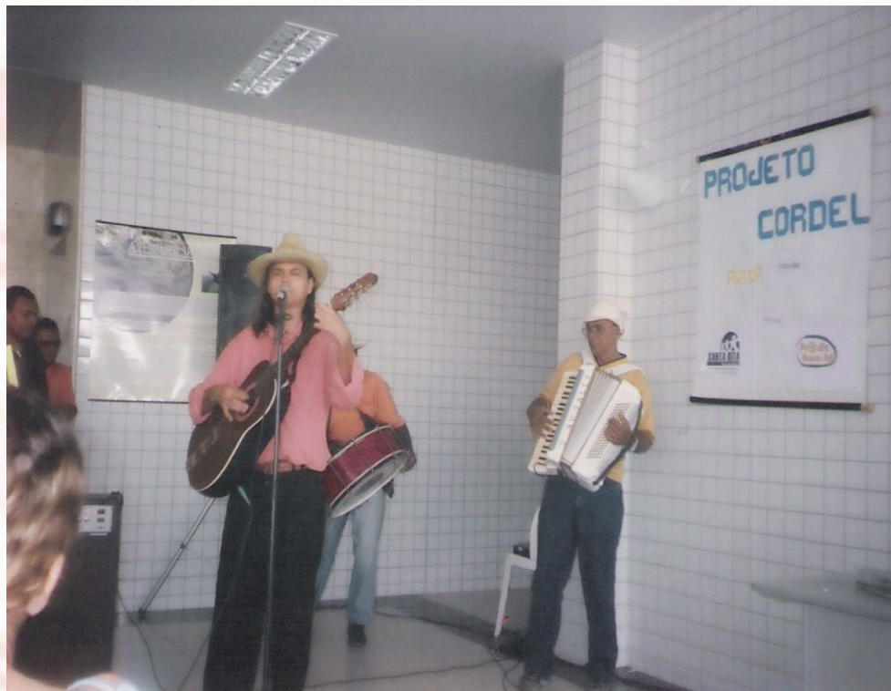
Universidade Vale do Acaraú - UVA João Pessoa-PB - 2006