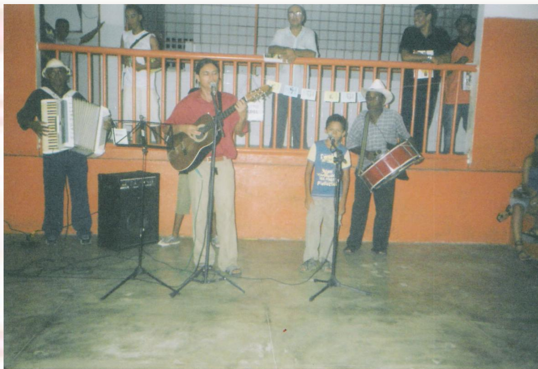
Escola Municipal Assis Chateaubriand Bayeux-PB - 2005