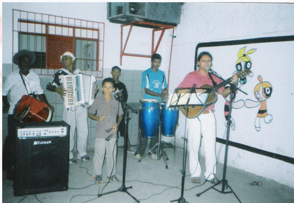
Escola Municipal José Mariz Santa Rita-PB - 2006