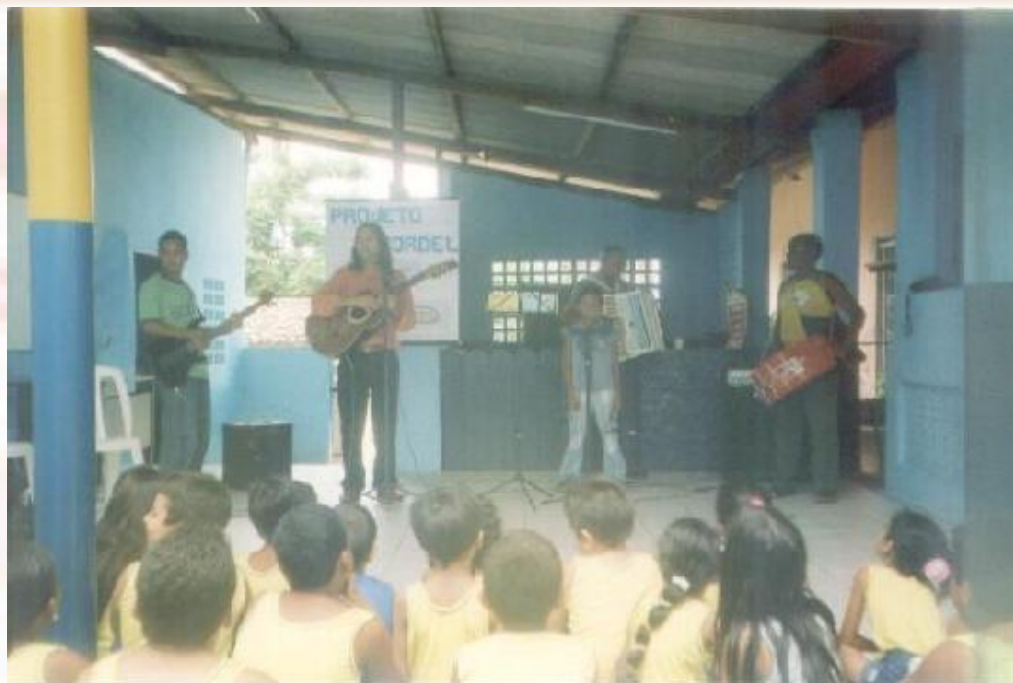
Escola Lápis na Mão Santa Rita-PB - 2006