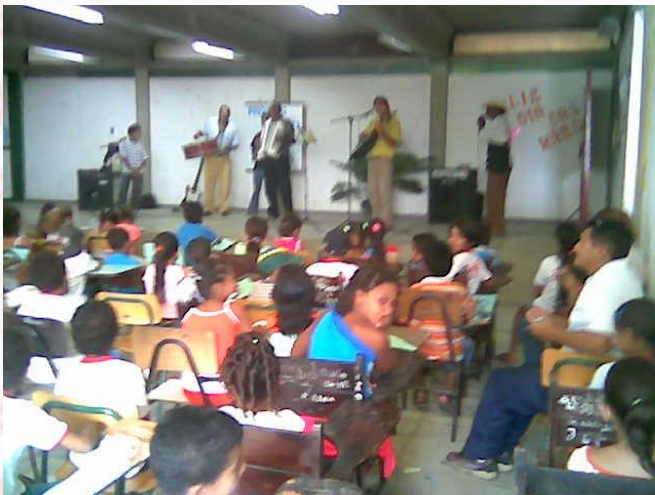
Escola Municipal Tiradentes Santa Rita-PB - 2006