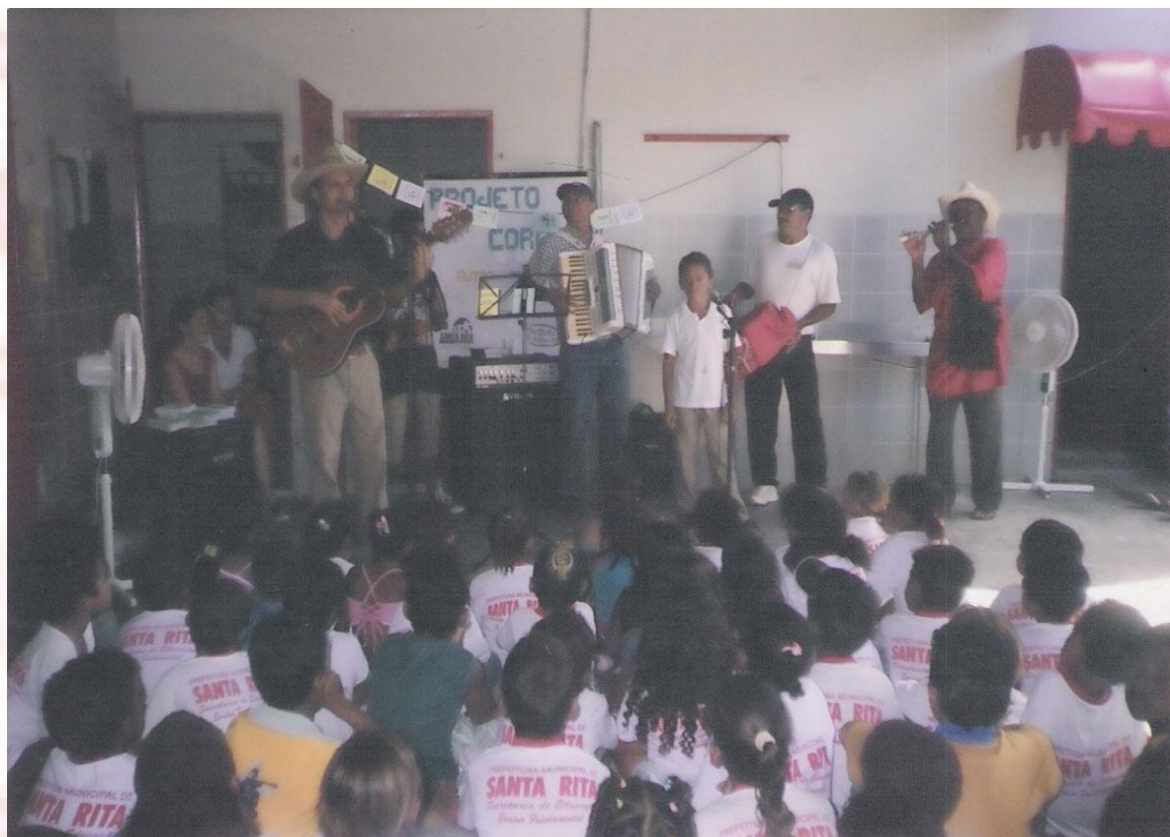
Escola Municipal Jaime Lacet Santa Rita-PB - 2006