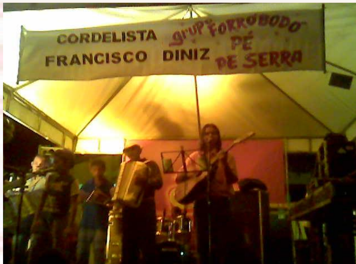
Bairro São José João Pessoa-PB - 2006