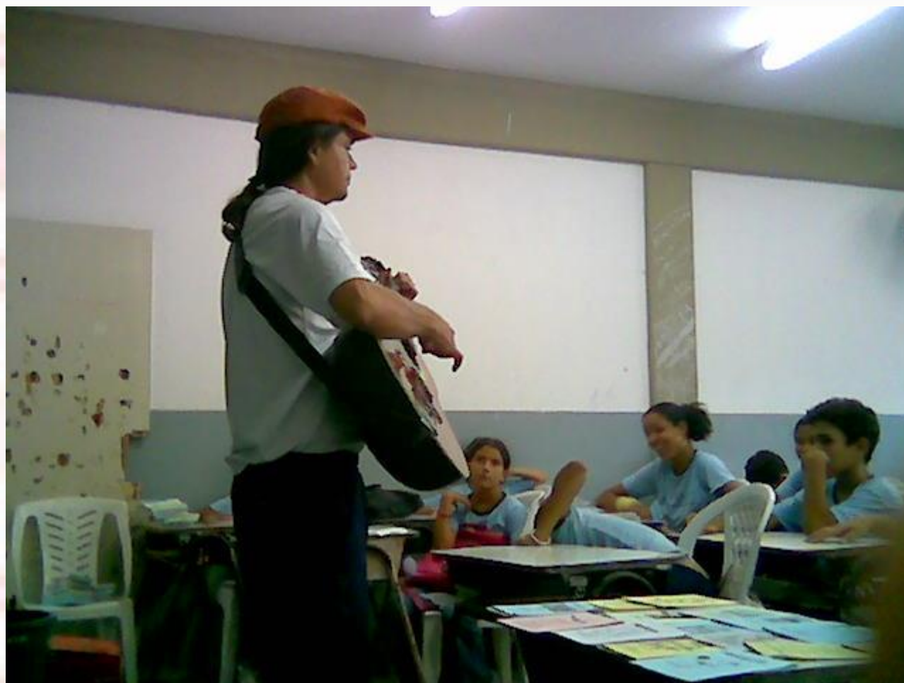
Escola Estadual Sesquicentenário João Pessoa-PB - 2006