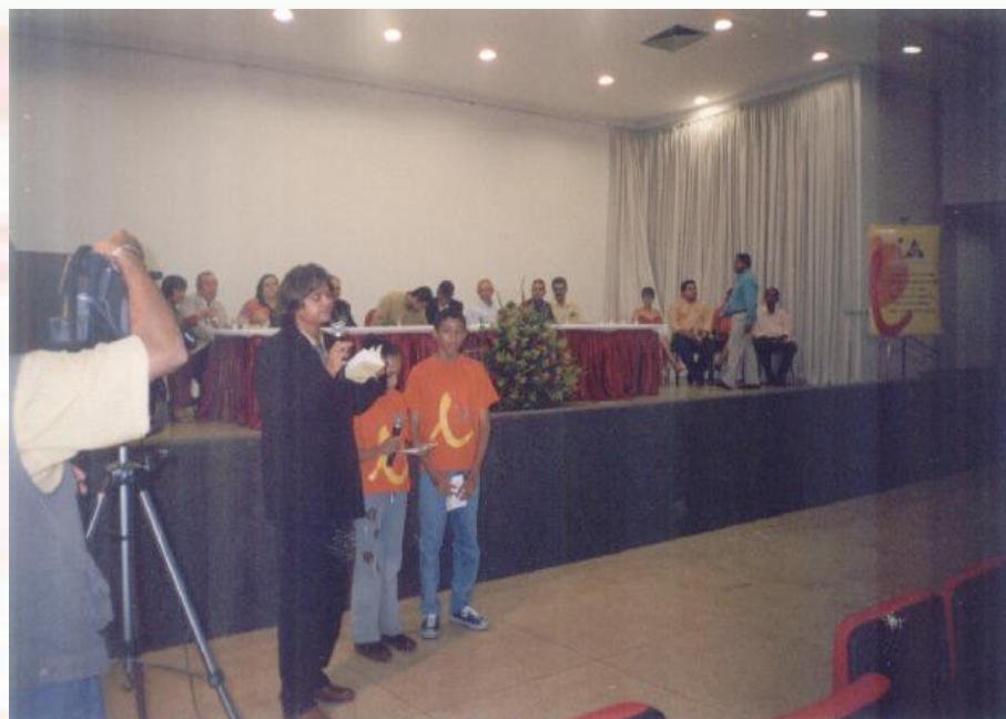
Universidade - UNIPÊ João Pessoa-PB - 2004