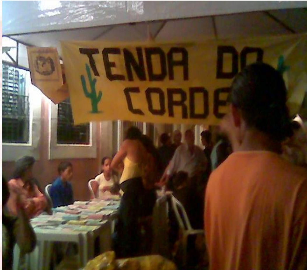
Festa de São João no Centro Histórico João Pessoa-PB - 2007