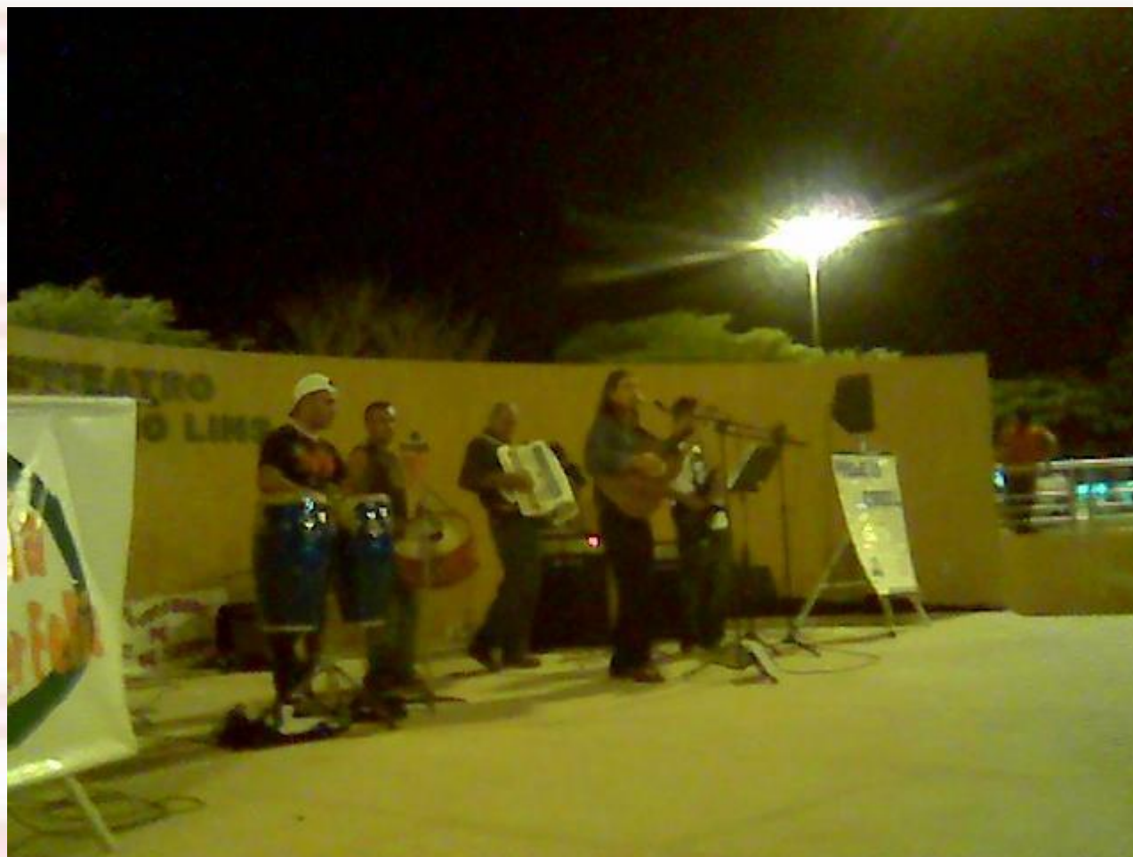
Praça da Paz João Pessoa-PB - 2006