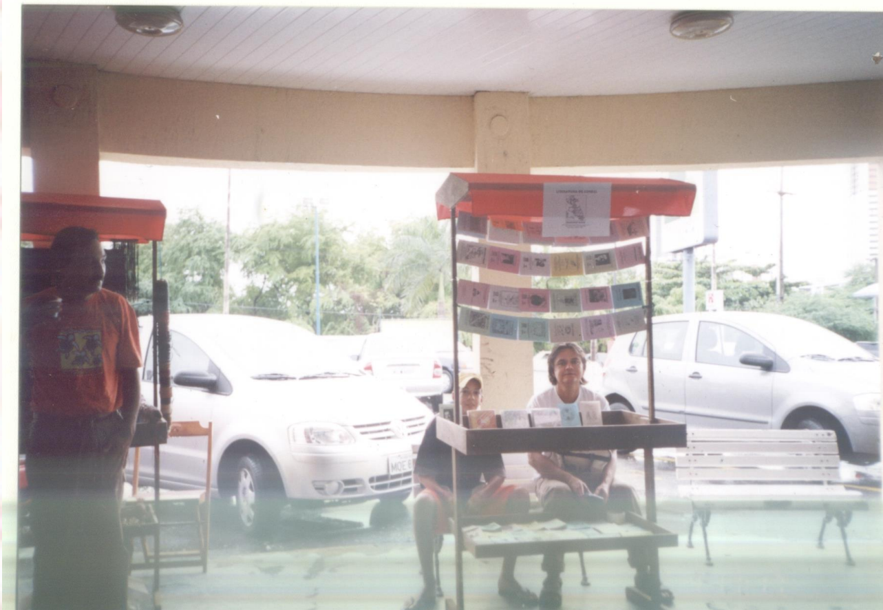
Supermercado Pão de Açúcar - Brisamar João Pessoa-PB - 2005