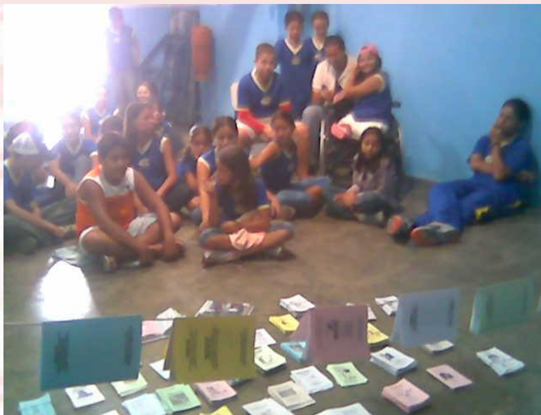
Escola Clodomiro Leal Bayeux-PB - 2006