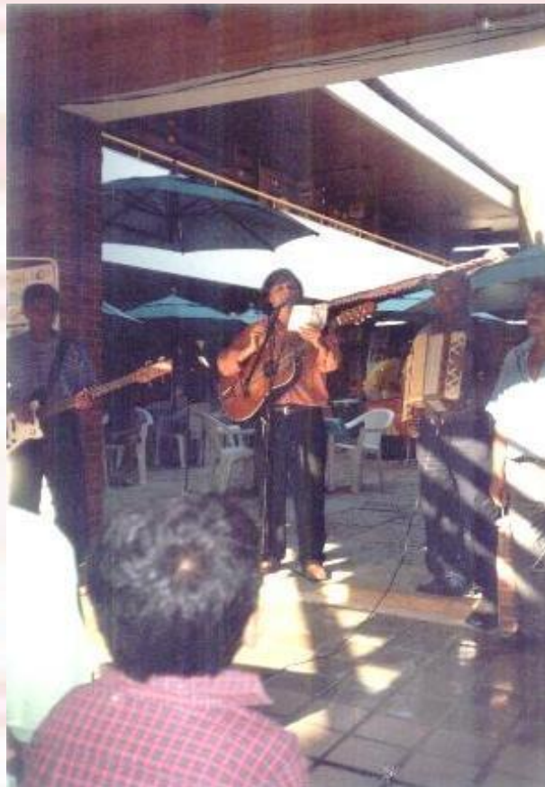
Mercado de Artesanato Paraibano João Pessoa-PB - 2005