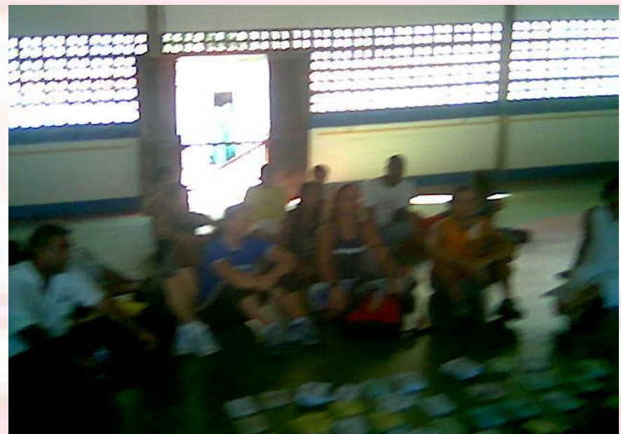
UNIPÊ – Curso de Ed. Física João Pessoa-PB - 2006