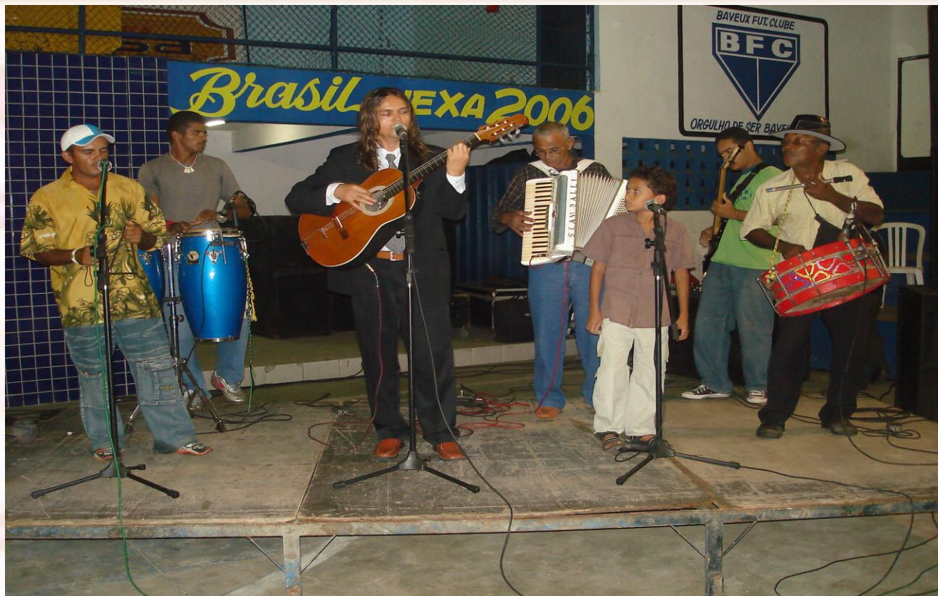
Ginásio Jaime Caetano Bayeux-PB - 2006