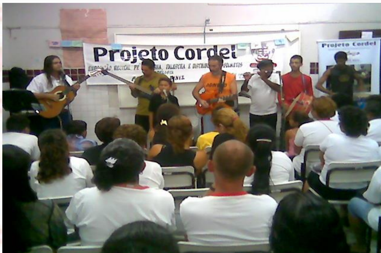
Escola Municipal João Coutinho João Pessoa-PB - 2007