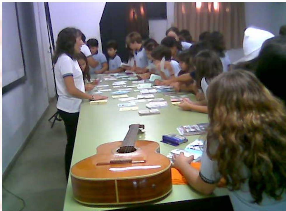
Escola Lourdinas João Pessoa-PB - 2006