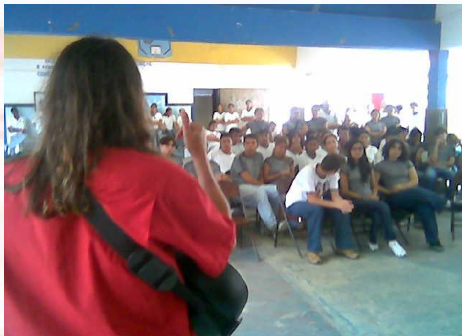
Escola Estadual Pe. Hildon Bandeira João Pessoa-PB - 2006