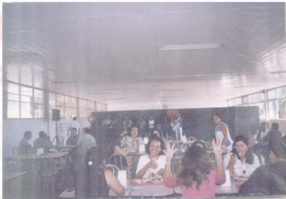
Fábrica Alpargatas João Pessoa-PB - 2005