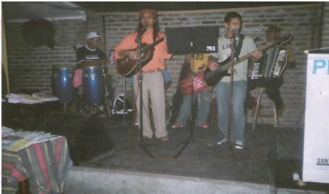
Bar e Restaurante Mr. Caipira João Pessoa-PB - 2006