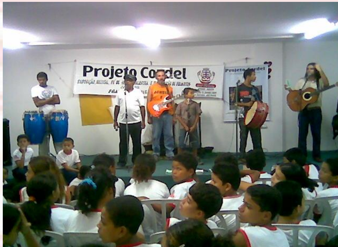
Escola Municipal Nazinha Barbosa João Pessoa-PB - 2007