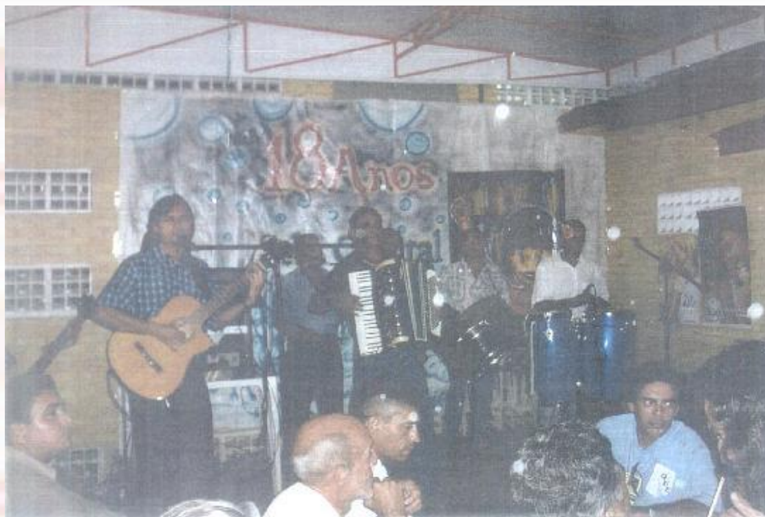
Livraria Sebo Cultural João Pessoa-PB - 2004