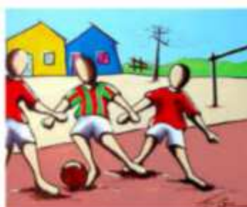
Meninos brincando de.....