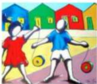
Crianças brincando de .....