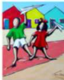
Crianças brincando de.....