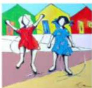
Meninas brincando de .....

Complete com o nome das brincadeiras (Pinturas do autor: Ivan Cruz)