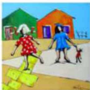
Meninas brincando de .....