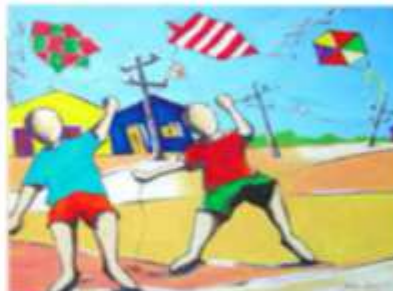
Meninos brincando de.....