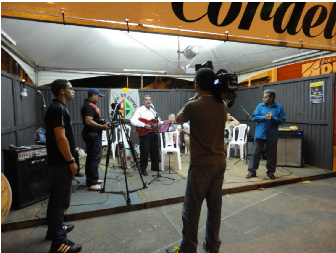
Em apresentação com cobertura da Tv Cidade de João Pessoa.